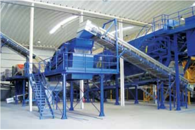
Centro de TMB Ambilital. Ermidas-Sado, Portugal (2011) MBT Plant Ambilital. Ermidas-Sado, Portugal (2011)