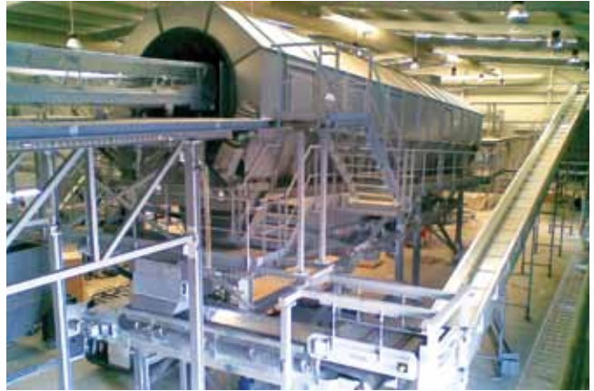
Centro de TMB de Mirandela. Portugal (en construcción) MBT Plant of Mirandela. Portugal (under construction)