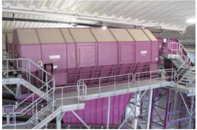
Centro de TMB de ERSUC. Coimbra, Portugal (2012) MBT Plant of ERSUC. Coimbra, Portugal (2012)