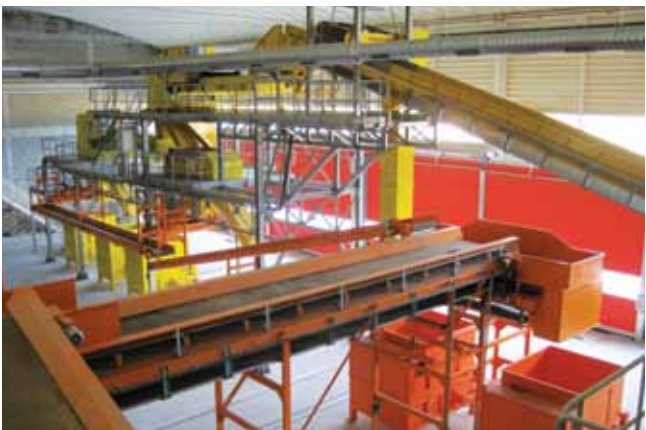
Centro de TMB de ERSUC. Aveiro, Portugal (2012) MBT Plant of ERSUC. Aveiro, Portugal (2012)