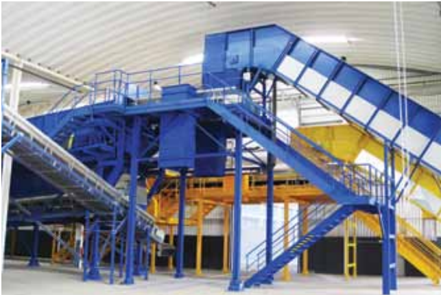
Clasificación de envases Ambilital. Ermidas-Sado, Portugal (2011) Packaging Sorting Plant Ambilital. Ermidas-Sado, Portugal (2011)